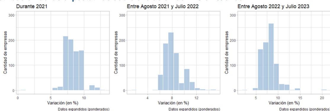
Distribución de las expectativas sobre evolución del IPC en % anual

Por otra parte, la mediana de la variación esperada de los costos operativos de las empresas es de 8,0% , 8,0% y 8,0% respectivamente.